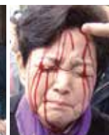
Les douleurs de la couronne d'épines