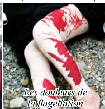
Les douleurs de la flagellation