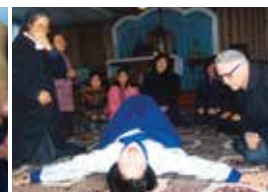
Les douleurs de la Crucifixion